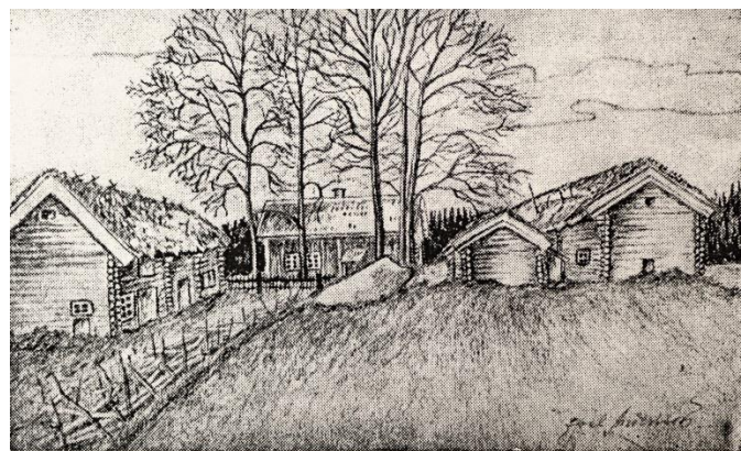
"Klockars", Heden. Blyertsteckning utförd av målarmästare Joel Fläcke (Andersson).