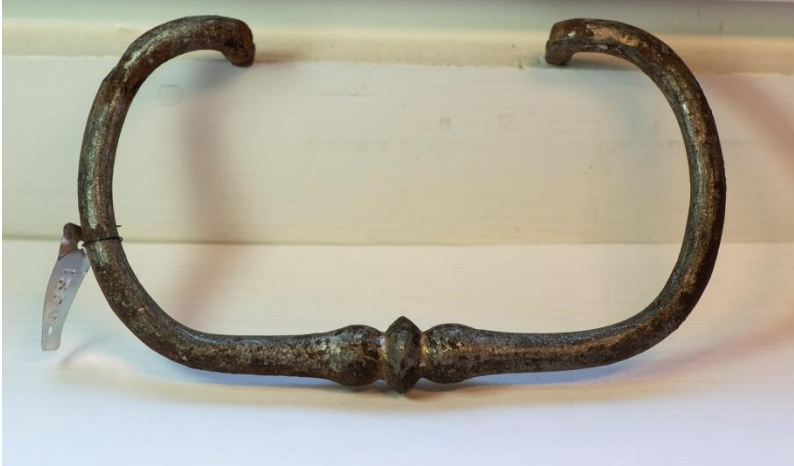
Det silverpläterade kisthandtaget.