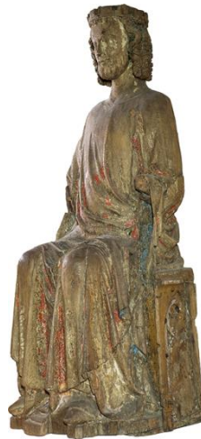
Helig konung 1300-talet

Denna äldre sakristia revs och ersattes med den nuvarande i samband med att även det gamla koret revs och ersattes med ett nytt i den tillbyggnad åt öster som gjordes på 1790-talet. De två gravplatser som fanns i det äldre koret (kyrkoherdegravnen och Axholmsgravnen) blev därvid igenösta (3) och Axholmsgravhällen ("Dimbostenen") fick utgöra trappsten upp till det nya koret innan den 100 år senare blev inmurad på sin nuvarande plats i södra