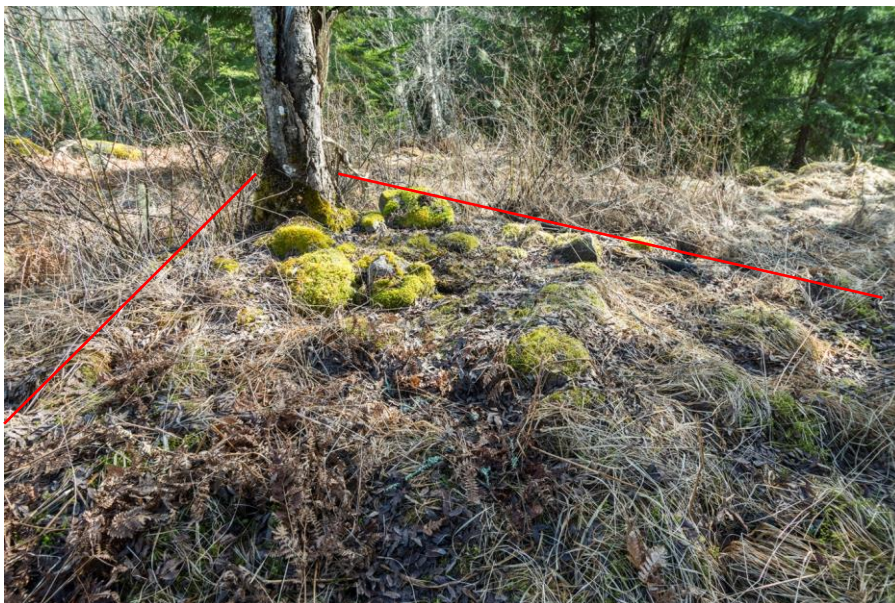
Torpgrunden med spisröse

Tegelbruket , ”tegelldan” ligger närmare sjön där en lång stenvägg med en öppning på mitten, vittnar om dess belägenhet. Vid norrändan på muren finns en stor grop och invid på höjden finns murtegelrester under mossan.