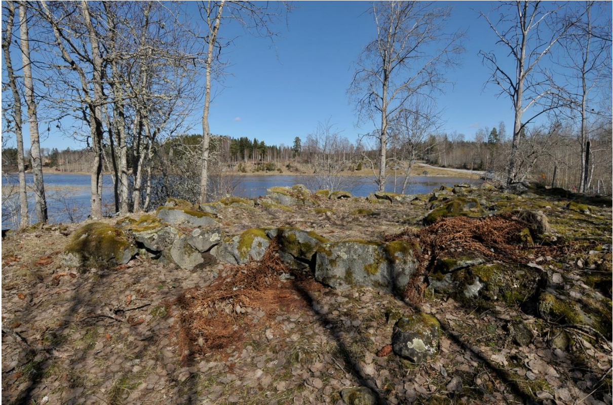
Brostugans grund invid Färjebron