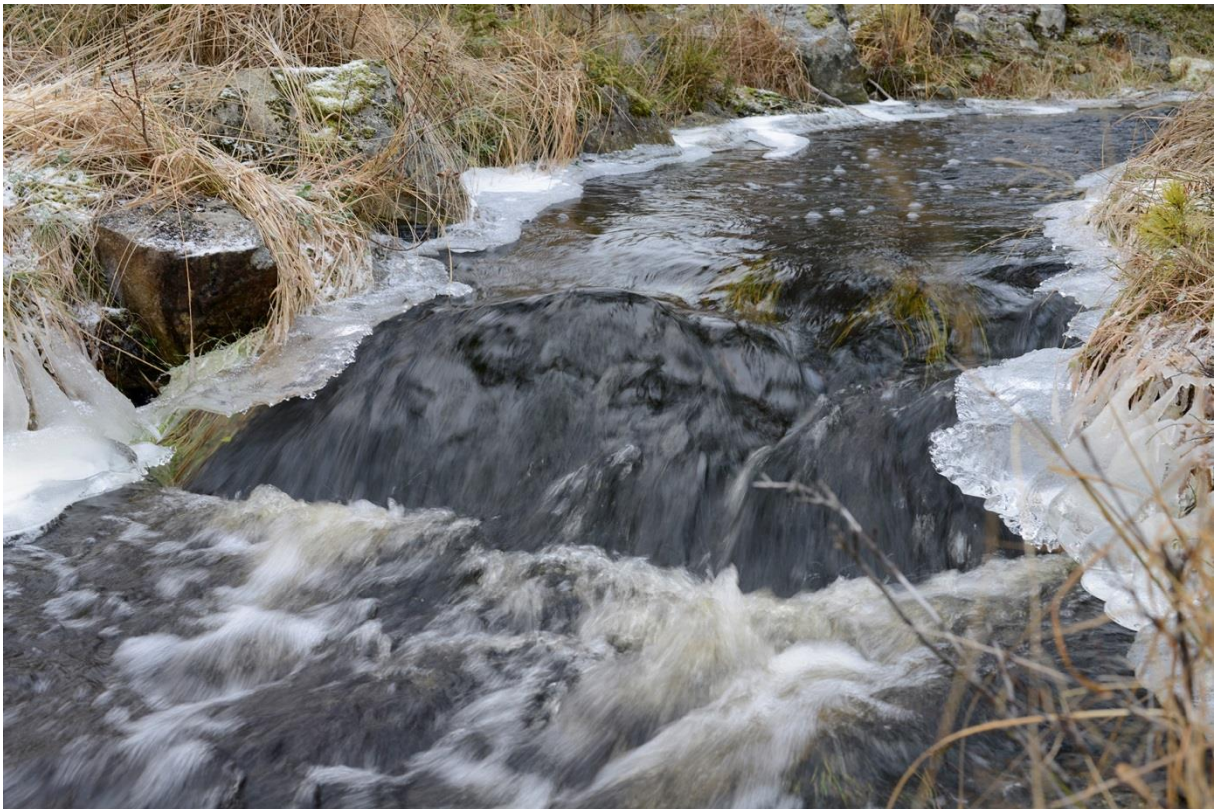
Fördämning 2, i Rolfs beskrivning.