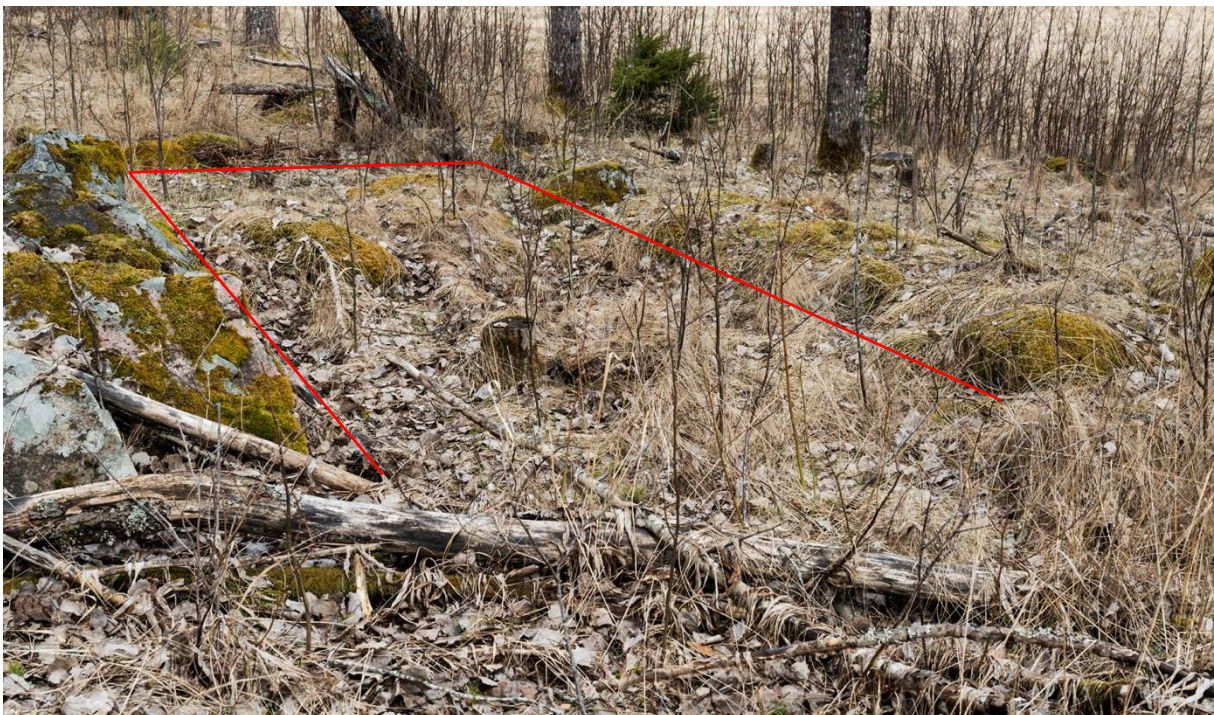
Grund efter byggnad vars innersta konturer märkt med röda streck.

Kan Nordansjö ursprungligen ha varit ett kyrkohegman och vid Gustaf Vasas reformation 1527 blivit indraget till Kronan? Och i så fall året därpå, 1528, bortbytt från Kronan till släkten Brahe som ägde angränsande marker (Rörbo gårdskomplex).