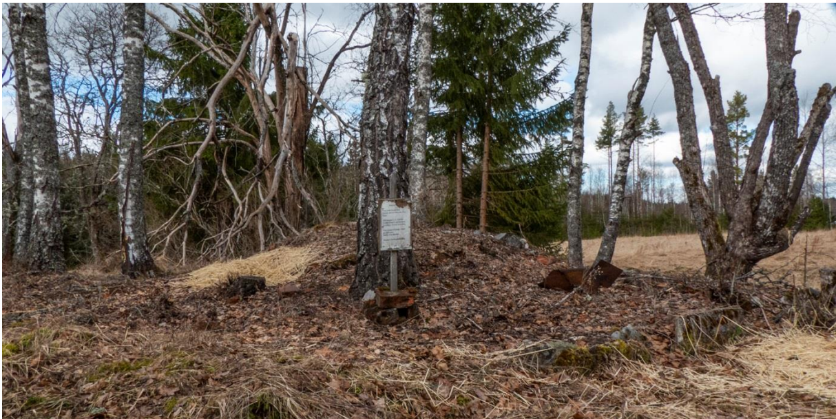
Torpgrunden efter Petersborg.

Status i dag: Tydlig torpgrund och jordkällare.