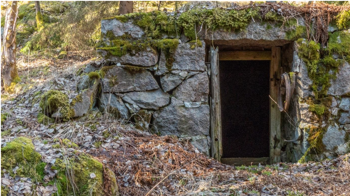
Emmylund's bevarade jordkällare.

Status i dag: Tydliga grunder, husen rivna på 1950-talet.