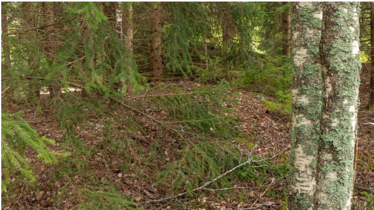
Mellan trädstammarna skymtar man grunden efter Persbo.