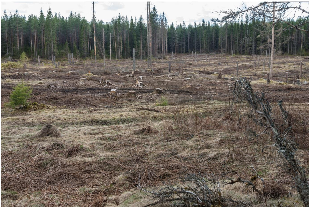
Här vid hygget låg hemmanet Dalkarlstorp, nu allt raserat.