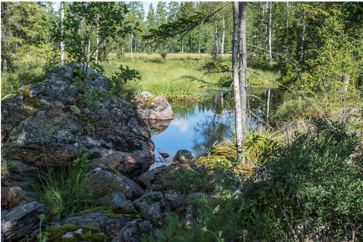
Fördämning 12, Bjurbäckens inlopp till L. Bjurdammen.