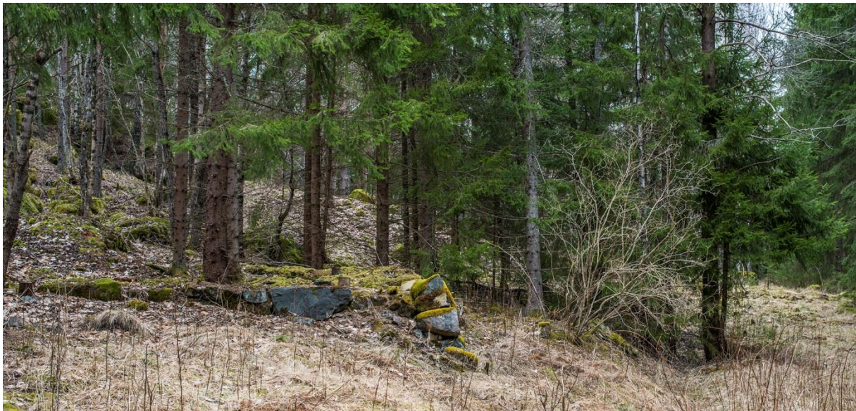
Nilsbo, grund efter mangårdsbyggningen.