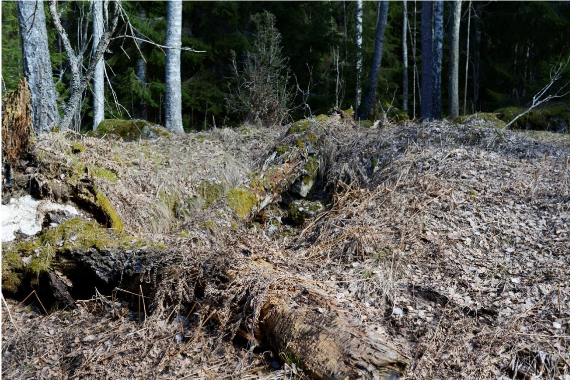
Gropen efter jordkällaren, verkar vara endaste spåret av liv vid Solhallet.