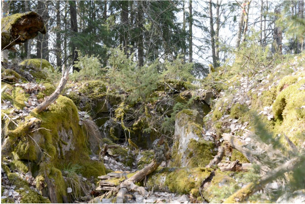
Jordkällargrund N. Sperringtorp