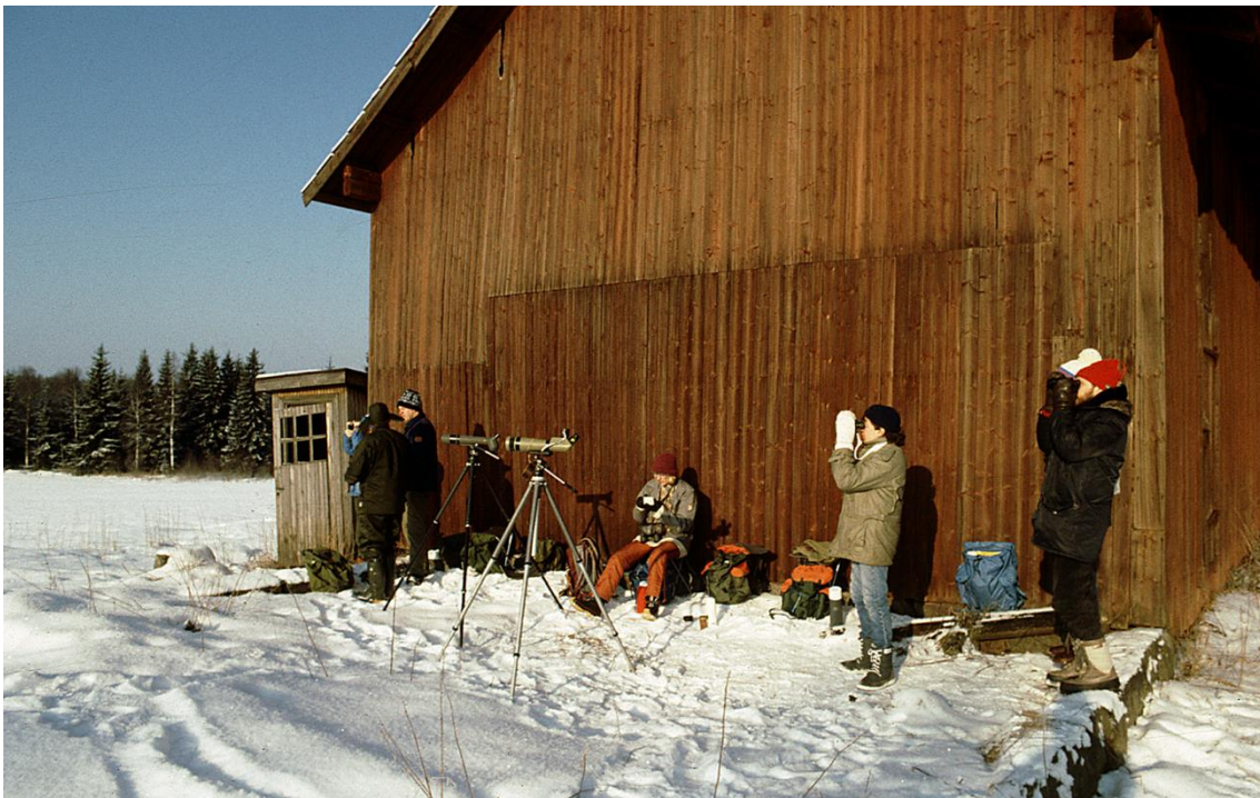
1988-02-20, Ladan vid Stora Svalnan