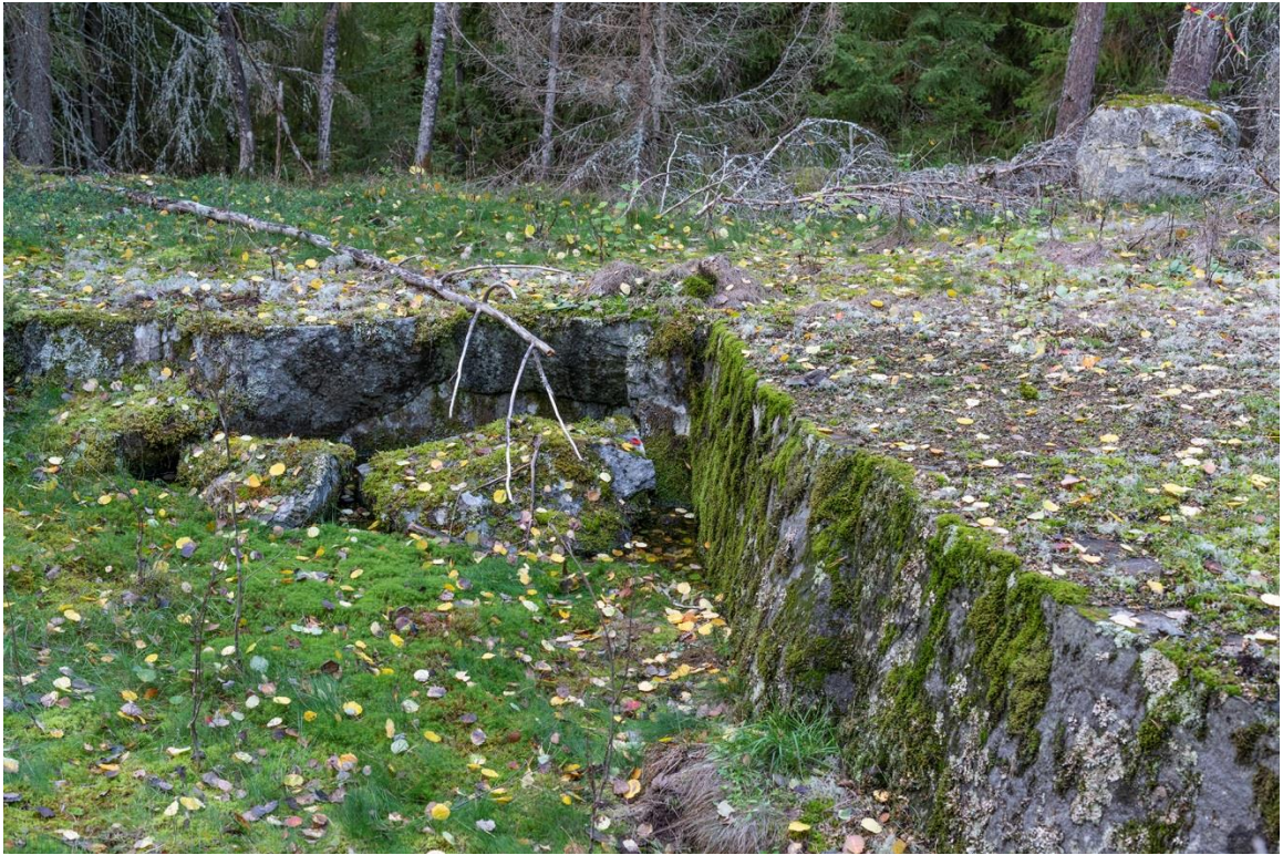
Skärpning norr om husgrunden vid Staffansbo