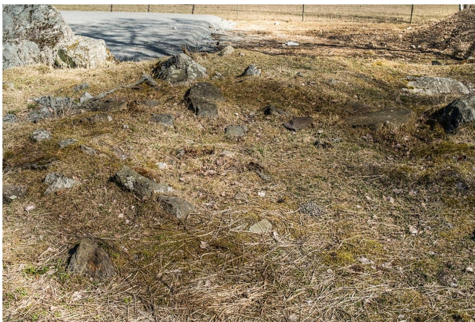
Kvarstående fundament efter smältugnen i Vevde

Övrigt: På nedanstående bild anas konturerna av en smältugn för bly/silvermalm, vars mått är omkring 1,5 x 0,75 m. C-14 datering av invidliggande bly/silver-slagg pekar mot 1300-talet och dess bly/silver halter överensstämmer ganska väl med de från Sala gruva. I närområdet har påträffats lösa block med förhöjda silverhalter. Platsen verkar i senare tid ha överbyggt med en smedja där också malmsmältning pågått. En del av dess ugnsväggsagg innehöll mycket höga silverhalter. C-14 datering av denna ugn antyder drygt 200 års ålder d.v.s. betydligt senare. Se vidare artikeln ”Vad slaggsumpslaggen ruvade på att få berätta... etc.” under rubrik ”Andra artiklar”.