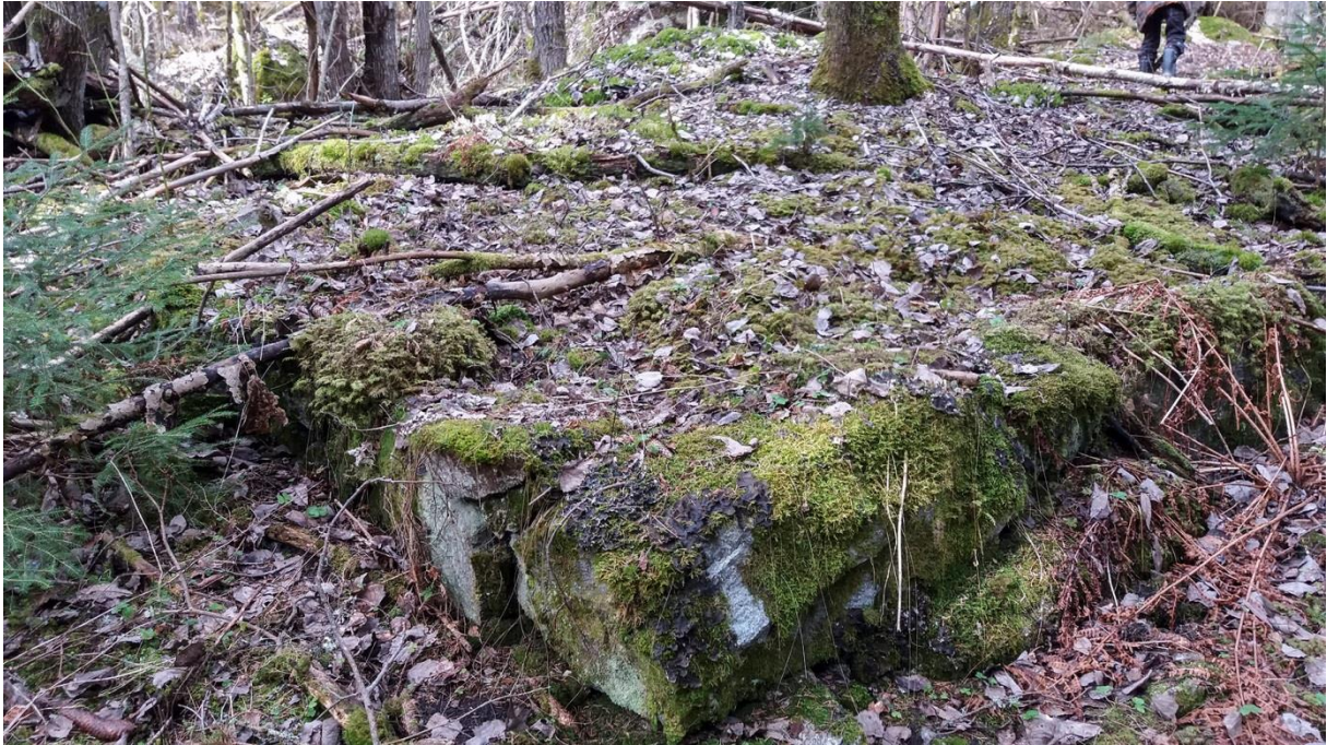
Hörnstenar efter äldsta Kronmossen (Persbo)