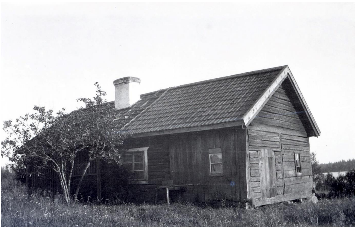
Ösjötorp med Öjesjön i bakgrunden, 1919

År 1458 omtalas ett "Örsyöboda" i Västerfärnebo socken. Gäller kanske snarast Örsingsbo som på 1600-talet ibland stavades "Örsjöbo" eller "Örsebo". Ösjöbyn benämns ibland på 1600-talet "Öja byn" vilket ju rimmar bättre med sjönamnet Öjesjön.