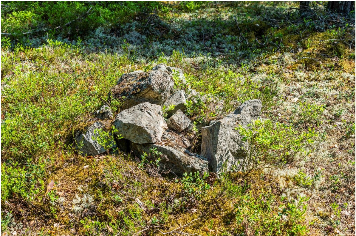
Stensättning – markering

Av människohänder tillverkat litet röse c:a 0,75 m, i diameter och höjden c:a 0,40 meter, liggande på en berghöjd men inte på högsta platsen. Syftet okänt, vi har i genomgång av olika kartor inte lyckats hitta någon gränslinje som röset skulle kunna svara mot. Stenarna i röset är inte av samma bergart, så det kan inte vara en sönderkörd eller frostsprängd större sten.