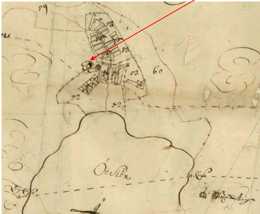
Lantmäterimyndigheternas arkiv, 19-VÄB-52, 1699

550 meter väster om Emmas Ösjötorp ligger på Västerfärnebosidan dagens Ösjöby och ytterligare 100 meter VNV finns ett runt fundament på en bergssluttning som förbryllar oss, ingen tycks veta dess forna ursprung. Men på nedanstående karta 1699 med ett hus markerande Ösjöbyn och alldeles VNV därom på ett berg finns en liten markering svarande mot detta fundament.