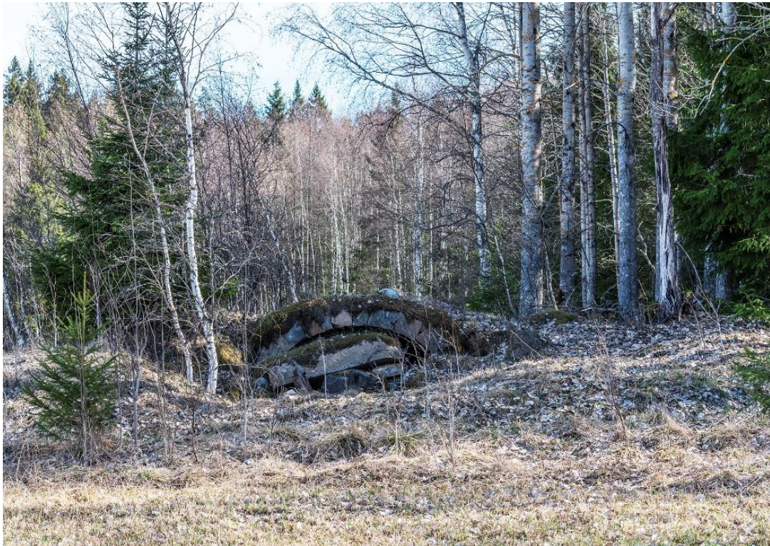
Den rymliga jordkällaren vid Bokhållartorp