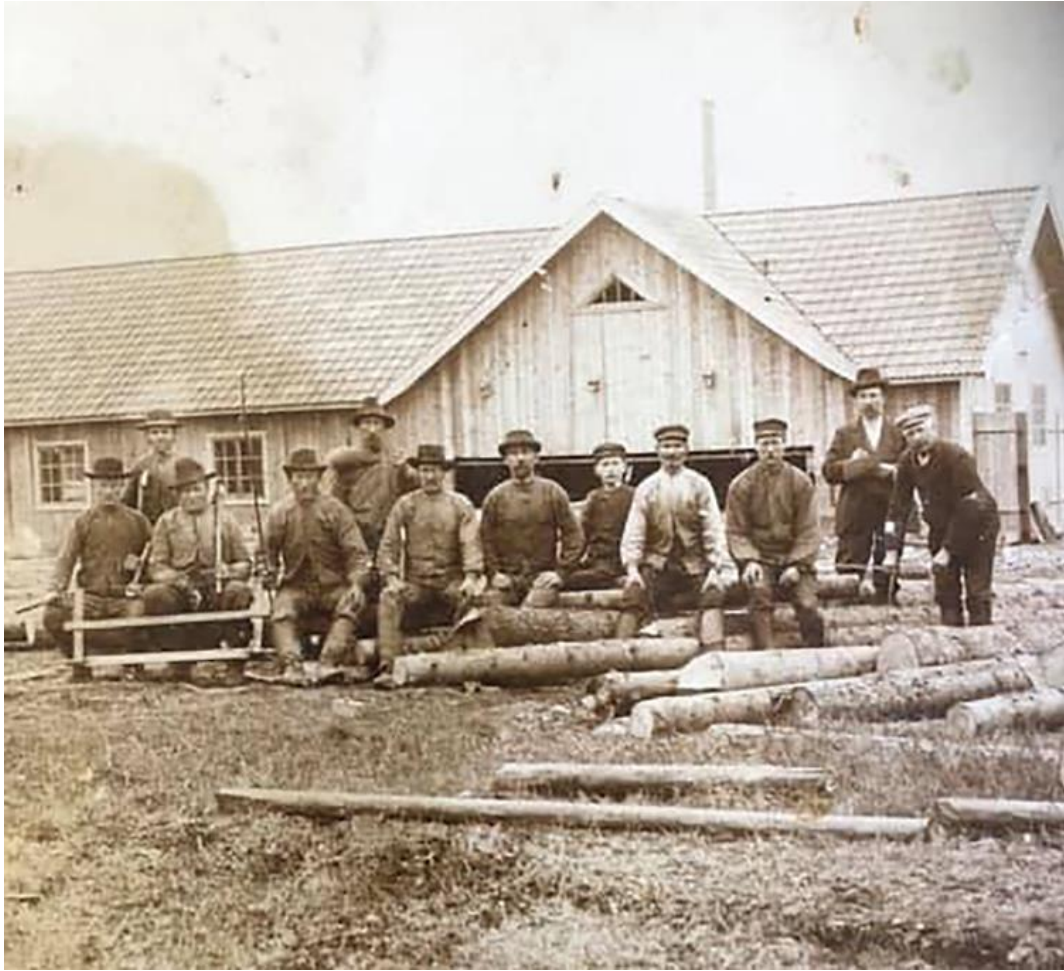
Enligt uppgift skall detta sågverk ha legat i Bokhållars. Kanske inrymt i den ganska stora loge som syns på karta från 1850?