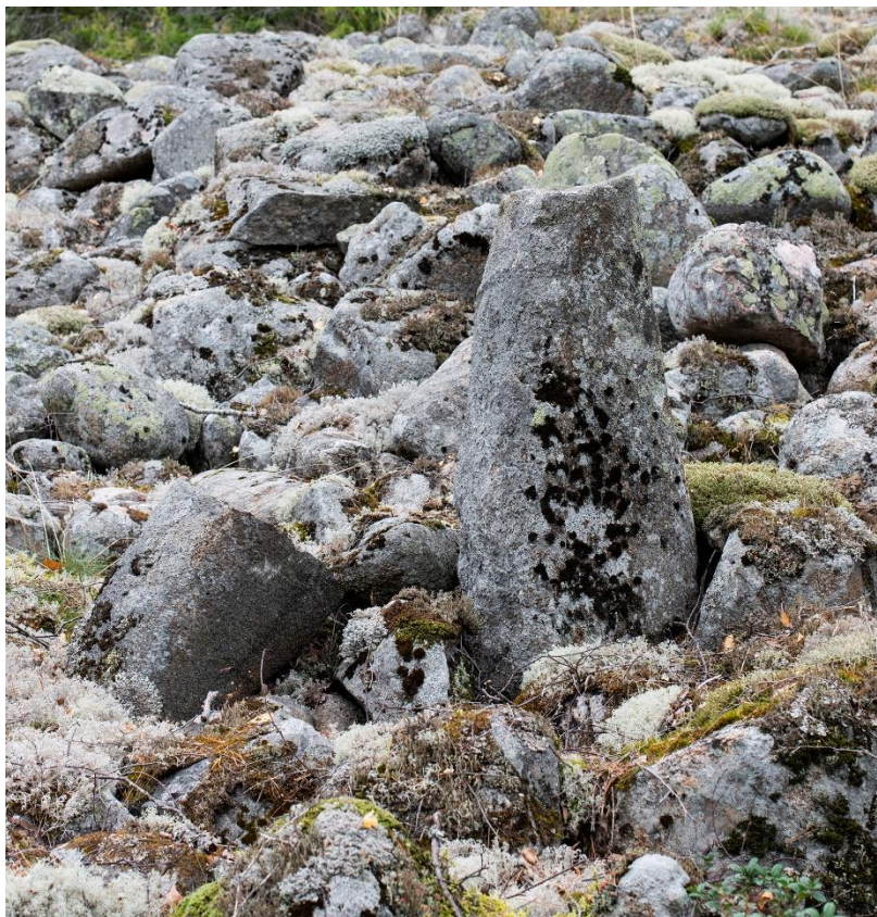
Röset med hjärtstenen i stenformationen