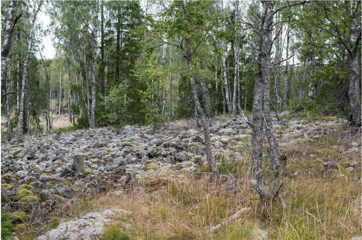
Övre delen av stenformationen med röset nere t.v.