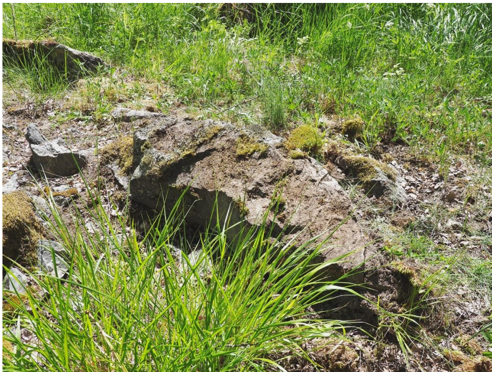
Både rösen 60b och 60c blev nog raserade vid ändringen av sockengränsen. Den mäktiga hjärtstenen vid 60c är lagd på sidan.