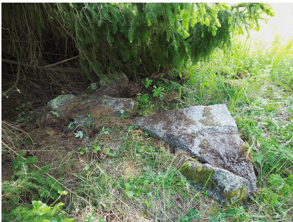
Röse 60b ligger under en mäktig gran