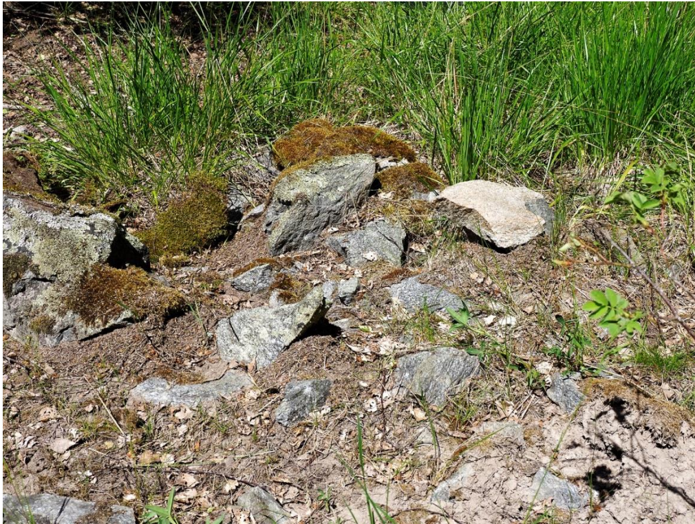
Röse 60c ligger närmare berget.