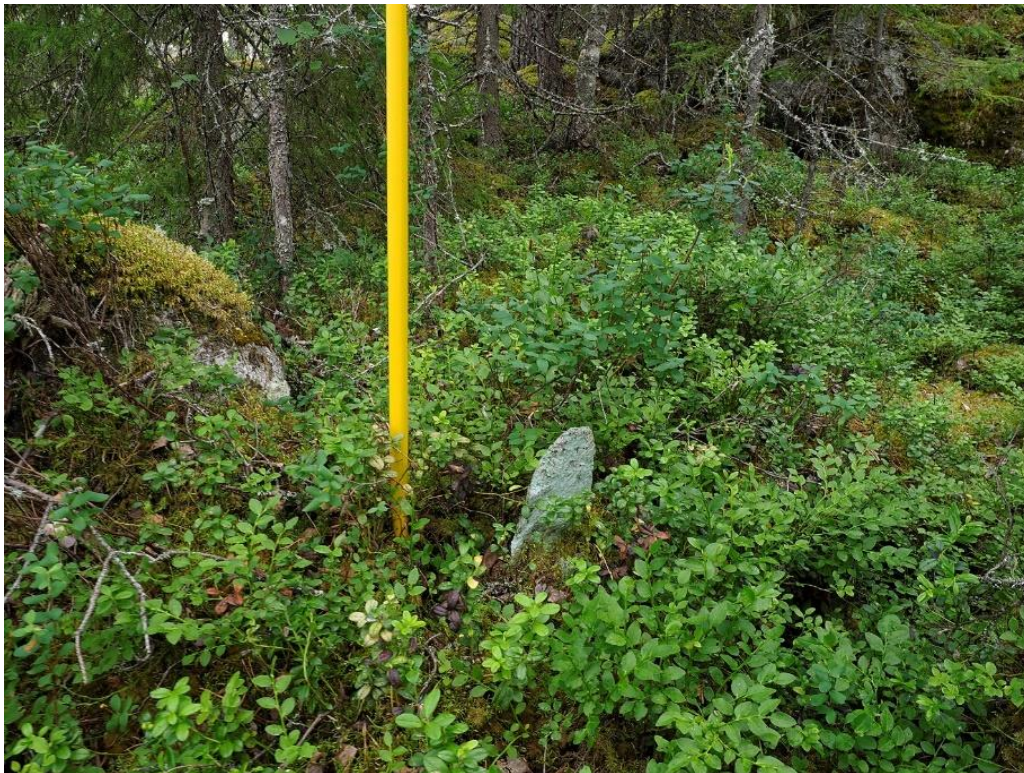
Vitmålad spetsig sten

Beskrivning: Precis invid Hagby Långmosses kant, uppstickande ur blåbärsris och mossor, en vitmålad spetsig sten.