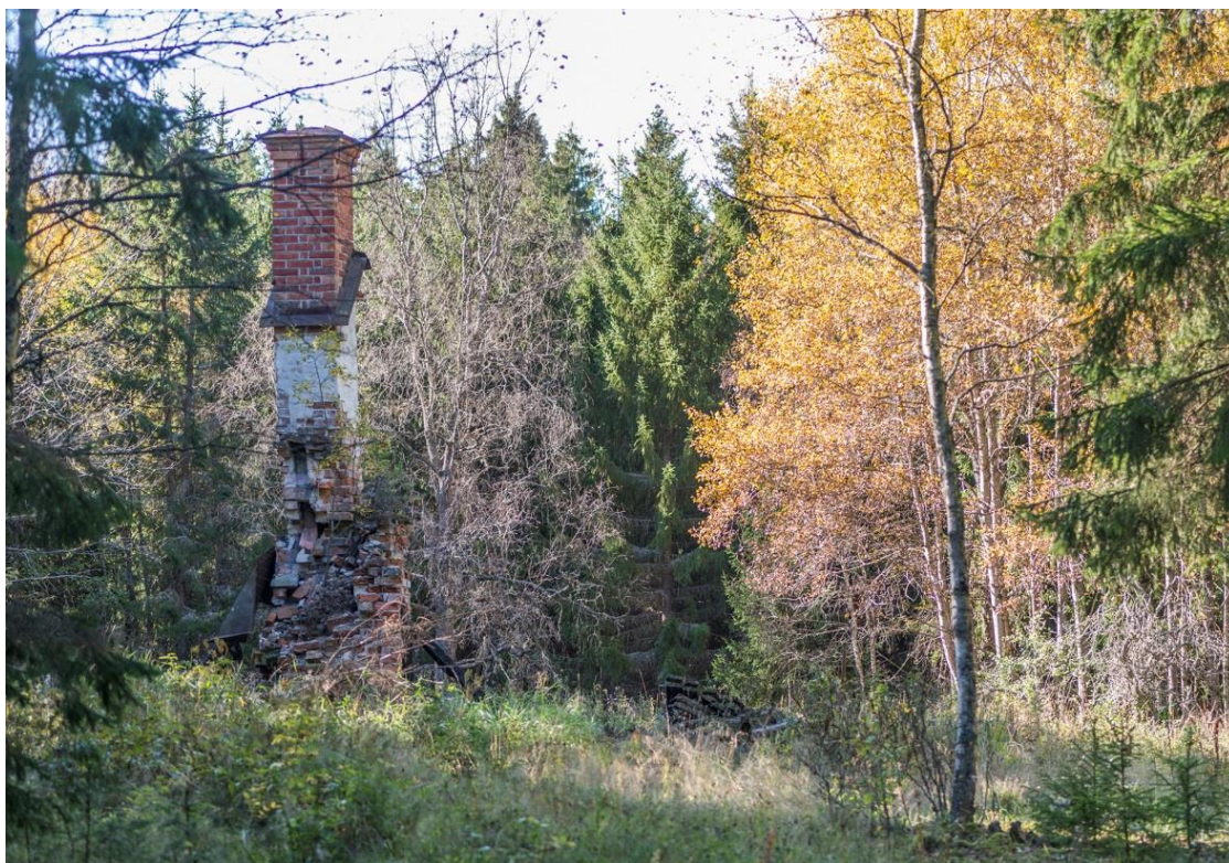
Minnet efter Krim