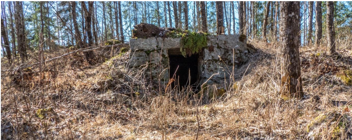
Den fint bevarade jordkällaren vid Västtoften.