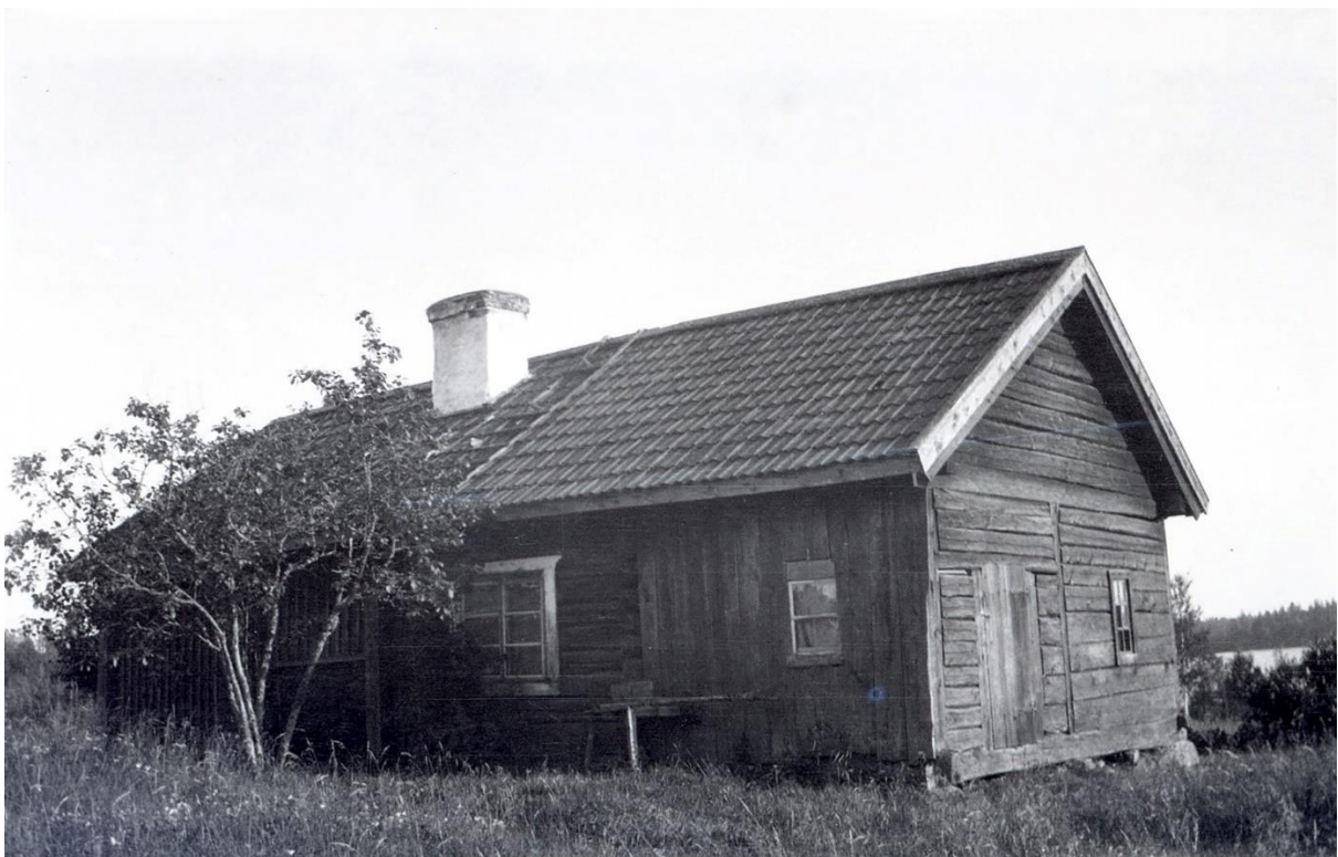
Ösjötorp med Öjesjön i bakgrunden, 1919