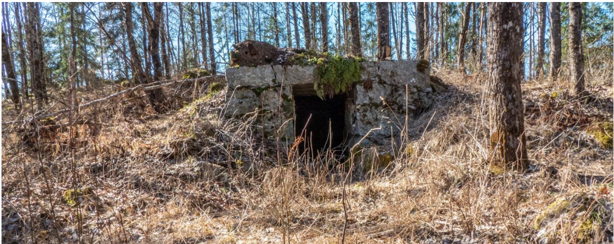
Den fint bevarade jordkällaren vid Västtoften.